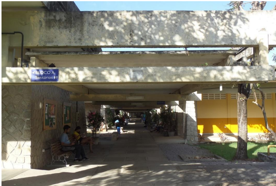
Figura 1 - Corredor principal

A visita foi realizada no dia 20 de junho de 2017, e assim, fotografou-se as manifestações patológicas nas vigas do corredor principal (figura 1) do setor III da Universidade Federal do Rio Grande do Norte (UFRN), que dão acesso aos blocos do A ao F.