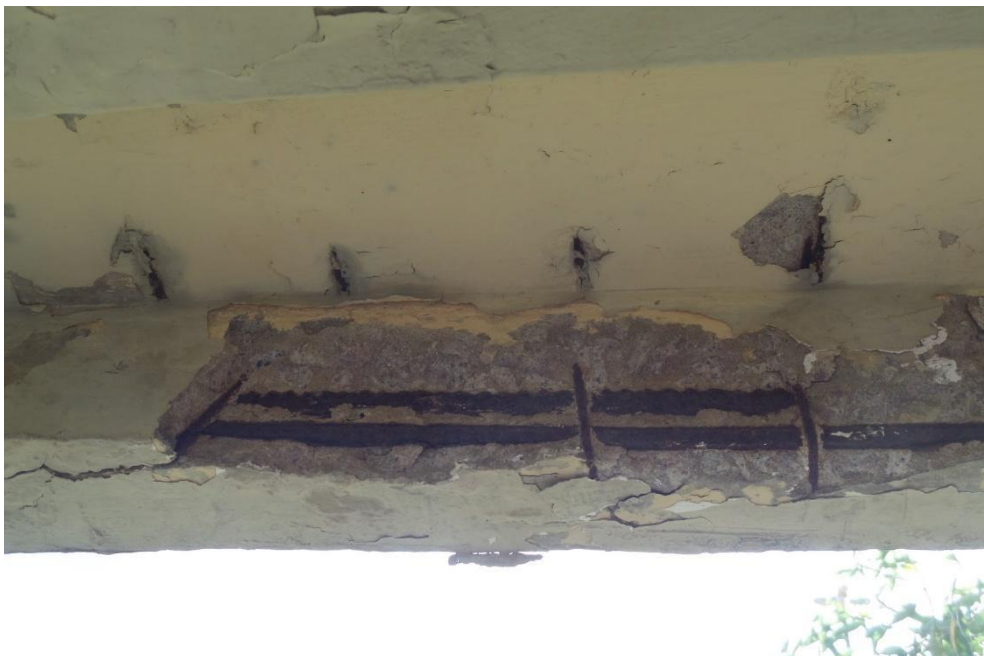
Figura 5 - Desprendimento da camada de concreto