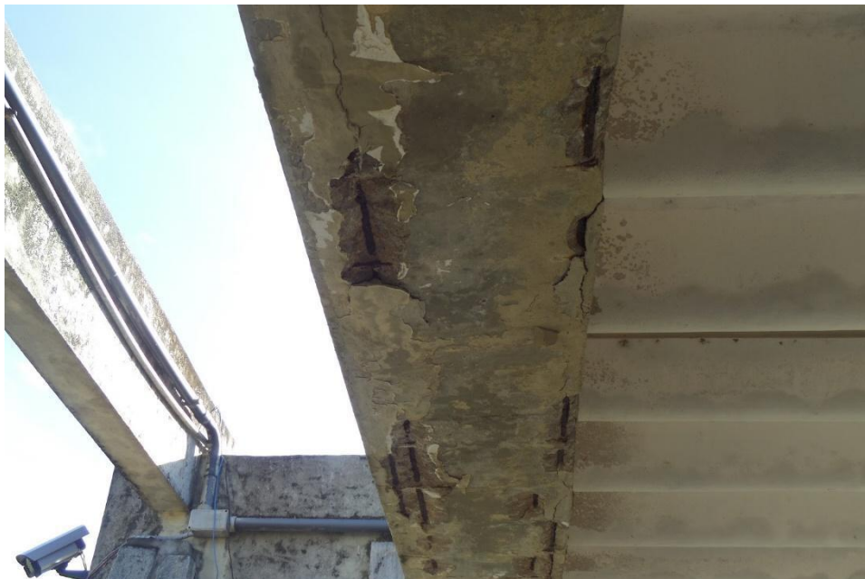
Figura 3 - Corrosão das armaduras

Durante a visita foram constatadas manifestações patológicas nas estruturas de concreto armado da instituição, que através de estudos bibliográficos, pode-se diagnosticar como corrosão nas armaduras. A figura 3 apresenta o defeito no elemento estrutural.