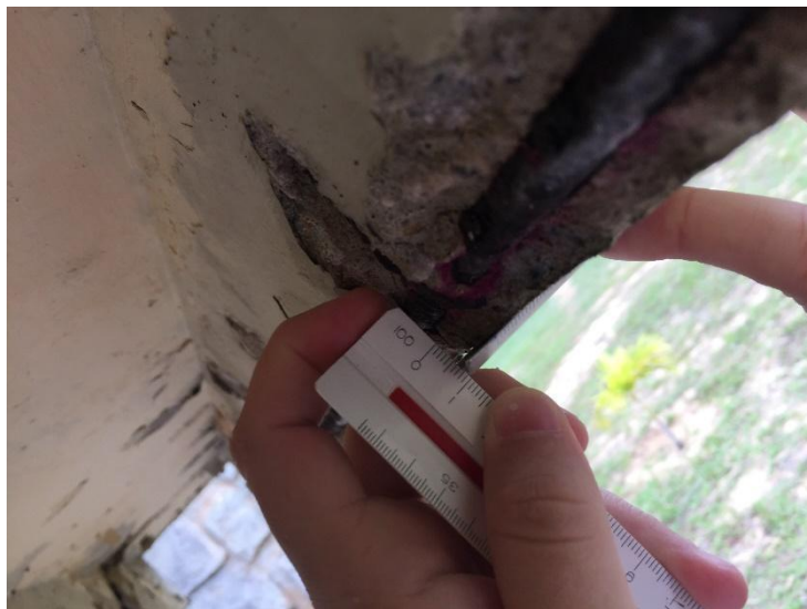
Figura 9 - Espessura do concreto carbonatado

Para quantificar a espessura do concreto carbonatado, foi utilizado o escalímetro - figura 9, e obtido uma espessura média de 6 mm na viga da figura 7.