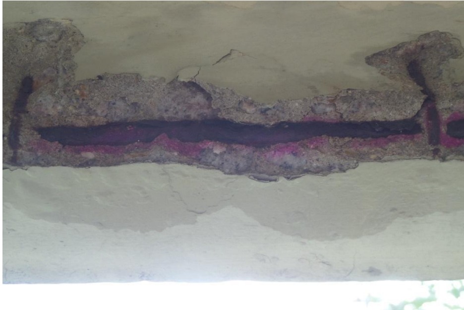
Figura 8 - Ensaio de carbonatação em um trecho da viga