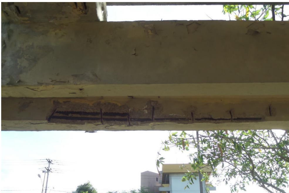
Figura 7 - Viga em situação precária

A figura 7 demonstra a situação da viga, com armaduras expostas em contato com o ambiente; ou seja, já não existe a proteção física proporcionada pelo cobrimento. Na figura 8 podemos observar o ensaio de carbonatação em um trecho da estrutura em questão.