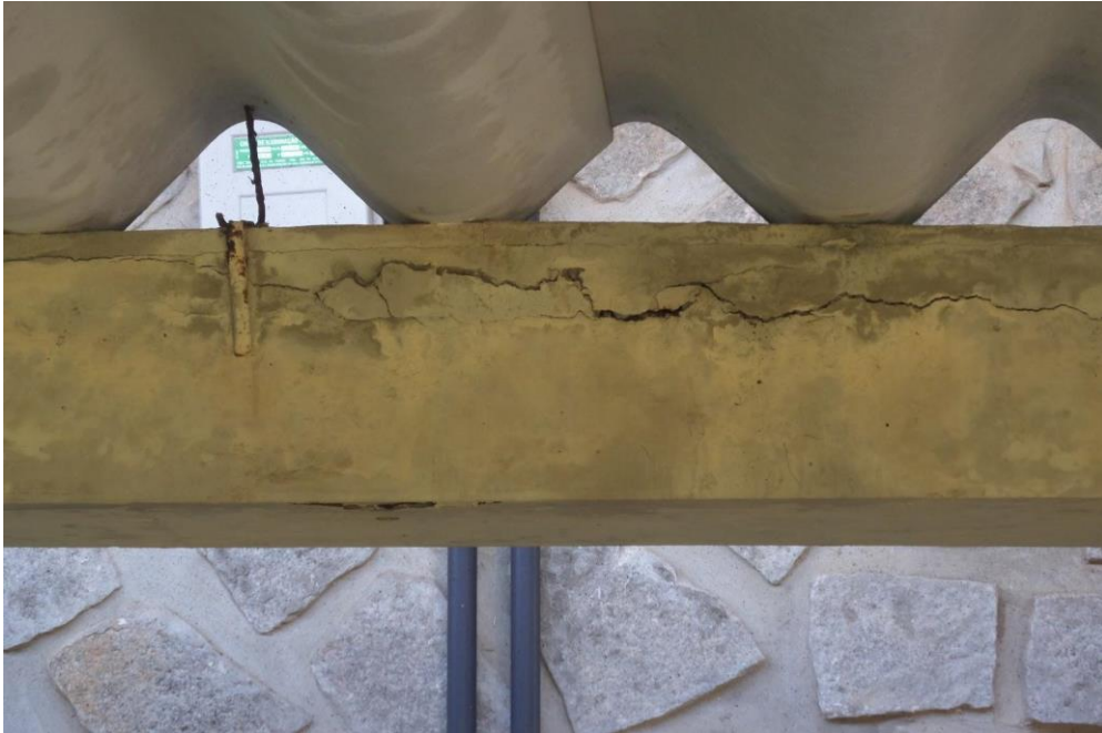
Figura 6 - Fissura no elemento estrutural