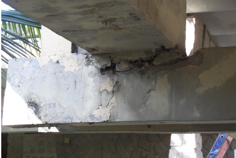
Figura 4 - Início do deslocamento do concreto

O início da corrosão nas armaduras resulta na formação de um produto volumoso, gerando tensões no concreto e resultando no desprendimento do cobrimento; como demonstrado na figura 4 e 5.